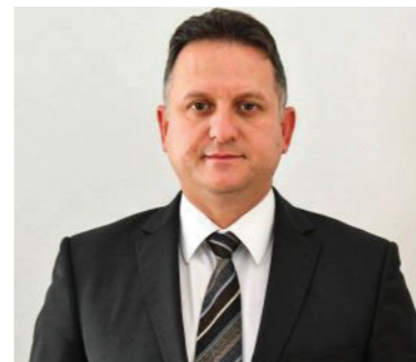
Hubai Imre a megyei közgyűlés elnöke